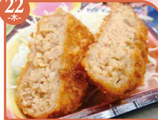
チーズメンチカツ