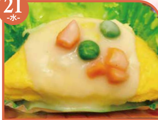
オムレツ ホワイトソースかけ