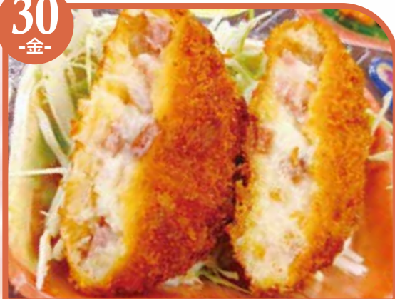
ベーコンマヨカツ