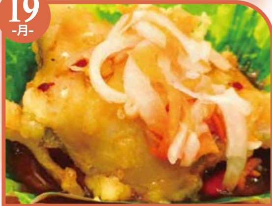
白身魚の南蛮漬け