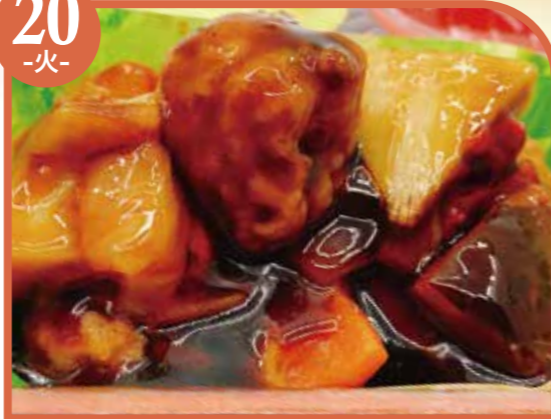
肉団子の甘酢あん