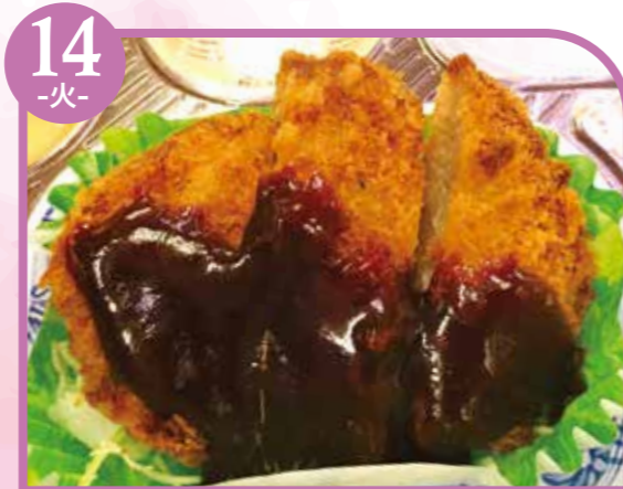
14 -火- とんかつ