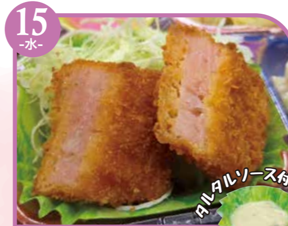
15 -水- えびかつ