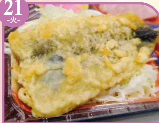
いわし天ぷら エネルギー307kcal / タンパク質12.3g / 脂質14.1g