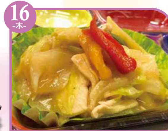
16 -木- 豚と野菜の塩炒め