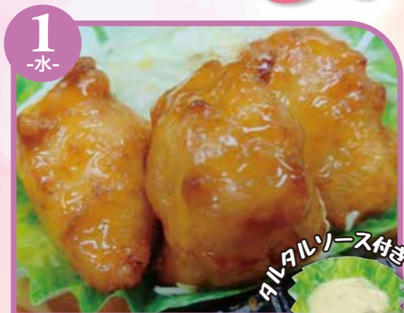
1 -水- チキン南蛮

栄養成分表記はおかずのみの成分値です。 ご飯は、100gあたり168kcalです。