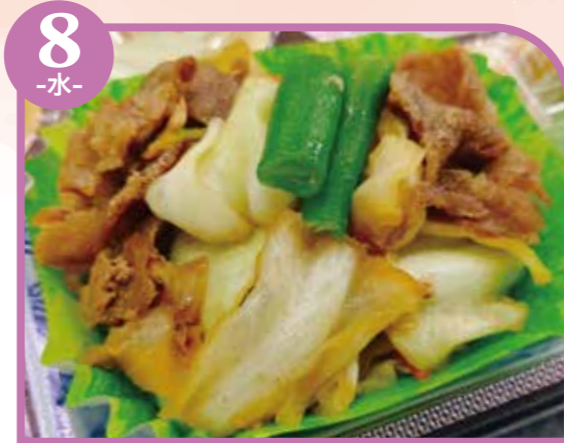
8 -水- 豚肉と野菜の炒め