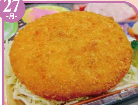
牛肉コロッケ エネルギー397kcal / タンパク質9.8g / 脂質22.8g