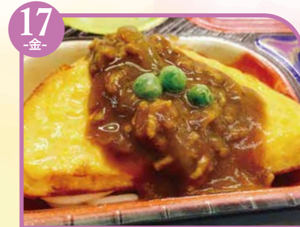
17 -金- オムレツカレーソースかけ