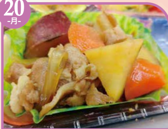
豚とさつま芋の甘辛煮 エネルギー333kcal / タンパク質11.1g / 脂質12.2g