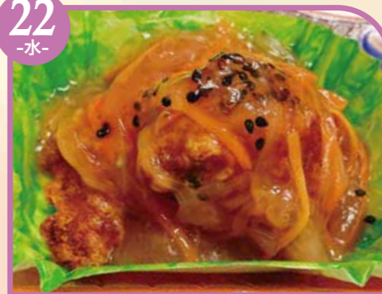
鶏の梅あんかけ エネルギー411kcal / タンパク質13.7g / 脂質22.4g