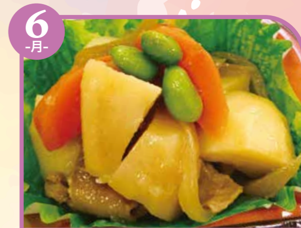
6 -月- 肉じゃが