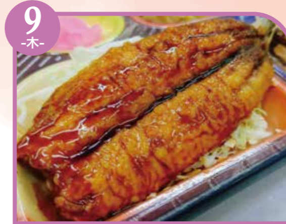
9 -木- いわしの蒲焼風