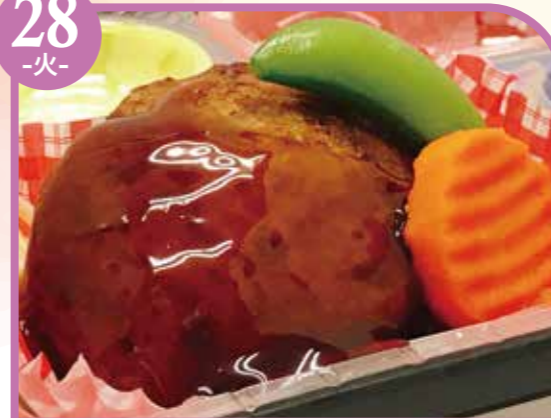
ハンバーグ照り焼きソース エネルギー311kcal / タンパク質15.1g / 脂質13g