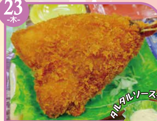
アジフライ エネルギー312kcal / タンパク質10.6g / 脂質22g