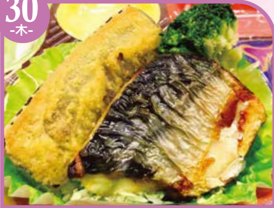
鯖の塩焼き エネルギー311kcal / タンパク質10.9g / 脂質17.8g