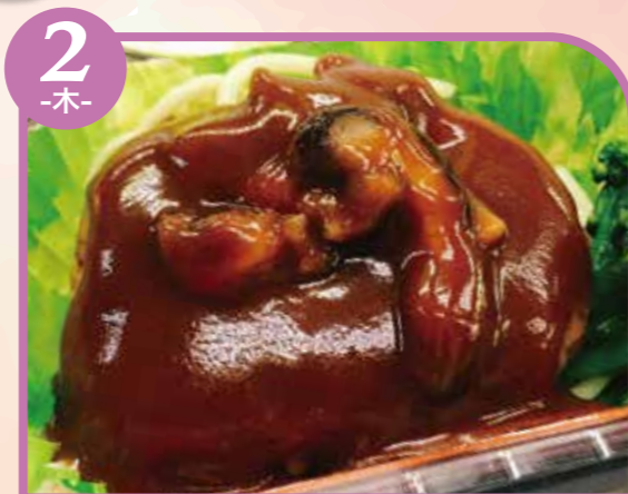
2 -木- ハンバーグ デミソース