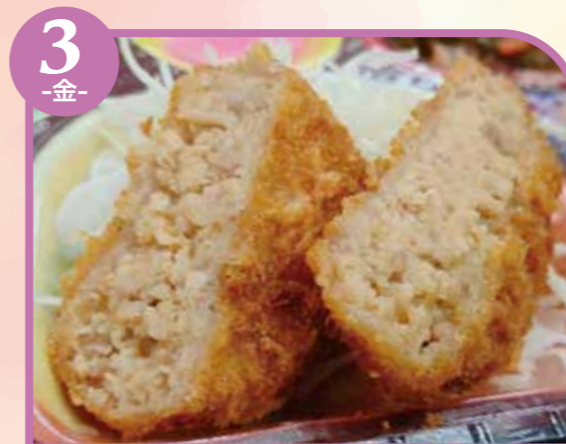
3 -金- チーズメンチカツ