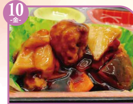
10 -金- 鶏だんごの黒酢あん