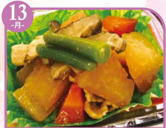
13 -月- 豚と大根の生姜煮