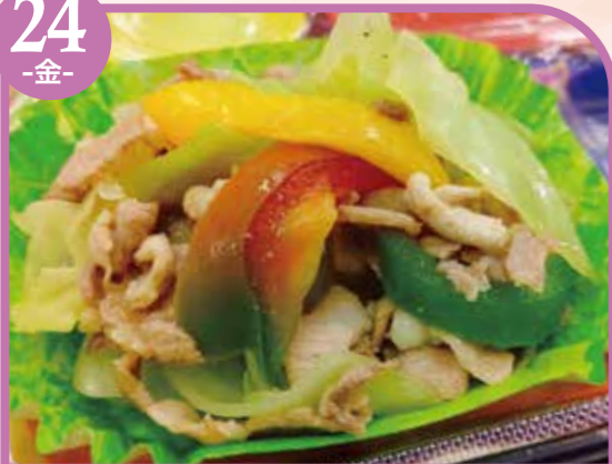
回鍋肉風 エネルギー260kcal / タンパク質13.4g / 脂質11.9g